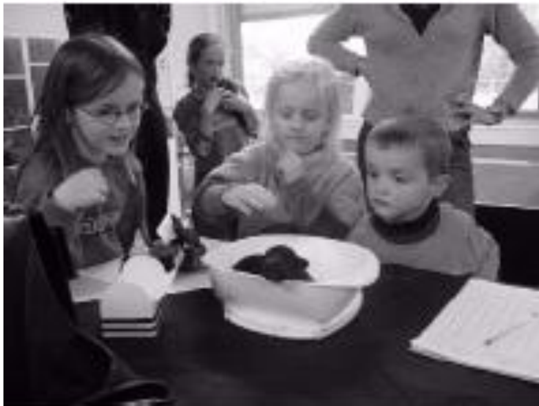
Houwaert's L-worp Vanaf het allereerste moment bij de pups betrokken zijn is een prachtig gebeuren. Hier op de foto de kinderen van familie de Beer.

Warmtelampen hebben als voordeel dat de ruimte verder niet in zijn geheel verwarmt worden. Ze nemen vaak wel wat extra energie. De meeste warmte lampen zijn 250 tot 500 watt. Voor de eerste paar dagen is een warmte lamp niet verkeerd. Mijn visie is echter wel dat pups die over een goed instinct beschikken van nature de moeder op moeten zoeken.