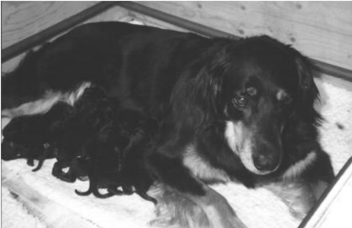
Houwaert's Brisca Cherise met Houwaert's G- worp